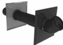
Raccord d'extrémité horizontal à tuyau simple