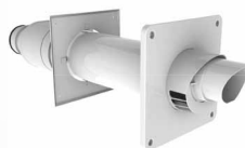
Raccord d'extrémité horizontal à tuyau concentrique

Installation d'un système PolyPro® avec raccord d'extrémité horizontal à tuyau double sous la dalle